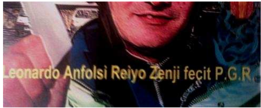
La formazione della perla celeste